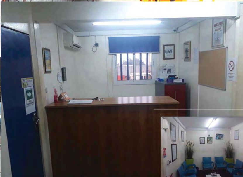
Secrétariat / Réception